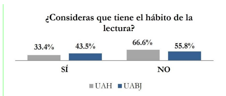
Figura 2. Índice de alumnos respecto al hábito de leer. Elaboración propia a partir de encuesta, 2014.

En la actualidad, en la llamada sociedad del conocimiento, el fácil acceso a los contenidos disponibles en internet y la aparición de otros medios electrónicos ha llevado a un cambio en la dinámica de los procesos de aprendizaje y comunicación, sobre todo entre los jóvenes. De ahí que dentro de los habitus o prácticas relacionadas con la lectura están evolucionando de manera constante y sustancial. Es decir, que las formas de leer y de aprender están cambiando. La tendencia para leer cada vez es más común hacerlo en formato electrónico y en diversos tipos de dispositivos móviles debido a que es más práctico y económico. También cada vez se generaliza más la utilización de plataformas educativas y una serie de recursos digitales de apoyo para el aprendizaje.